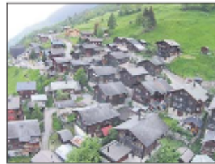
Betten – ein Dorf in Feststimmung.

tung Bettmeralp verkehrt um 1.00 und 2.00 Uhr früh, eine Bahn Richtung Betten Talstation um 1.30 Uhr. ☞