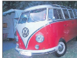
Das VW-Bus-Treffen hat Tradition.

Am Samstag spielt die AK-Band. An beiden Tagen werden Grillspezialitäten serviert und es gibt einen Barbetrieb. ☞